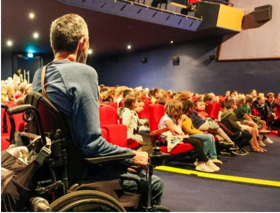
Participation lors d'une sensibilisation le 19/9 au Théâtre Montdory à Barentin à l'occasion de la projection du film « We are people »