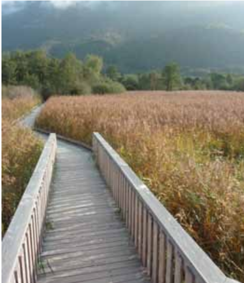
Platelage au sud du lac