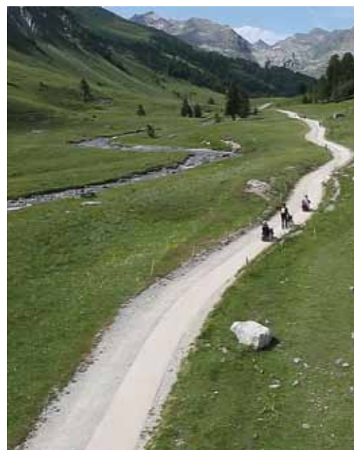
Sentier aménagé dans le vallon du Lauzanier - PNM

Pour voir le clip sur le sentier rendez-vous sur www.parcsnationaux.fr , rubrique découvrir - visiter - partager.