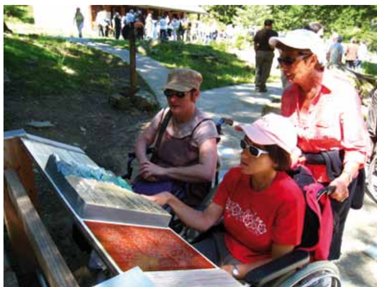
Visite du PNP