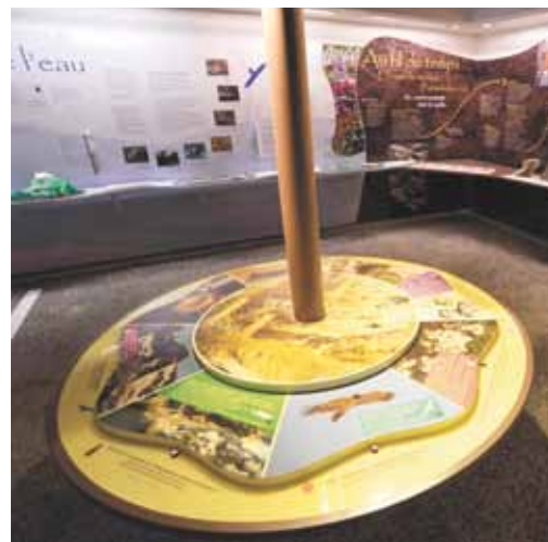
Maison du plan d'Aste

Porter également une attention particulière à la qualité de l'éclairage.