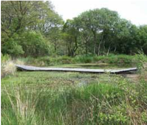
Lan Bern mare pédagogique