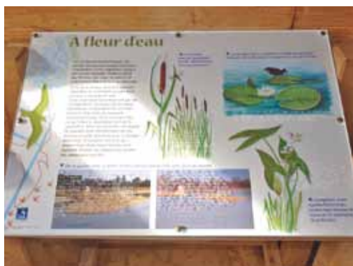
Panneau d'aide à l'observation en braille