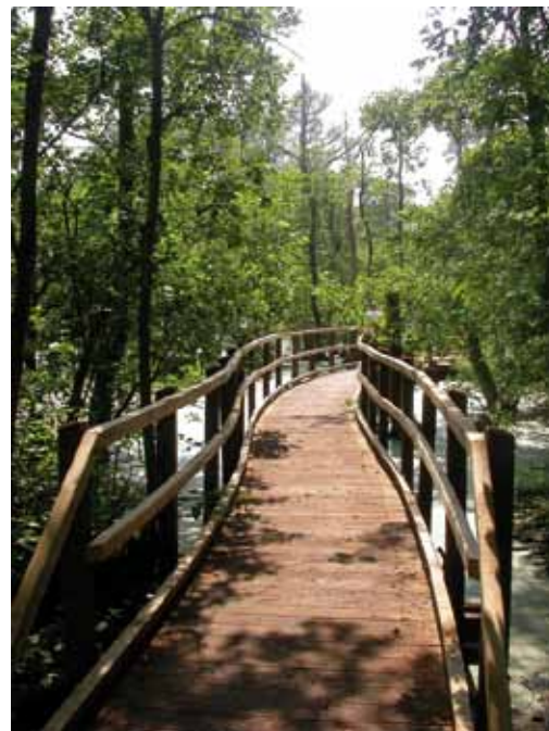
Grande passerelle du marais de Cambrin

Le site est dorénavant fréquenté par les habitants des environs, sans que la population ne le considère réellement comme un espace protégé, ce qui pose des problèmes d'entretien (déchets, actes malveillants...). D'où la nécessité de bien planifier les entretiens avec les communes propriétaires, car la maintenance est un poste important et nécessaire dans le cadre d'un sentier tous publics (longévité, fonctionnalité...).