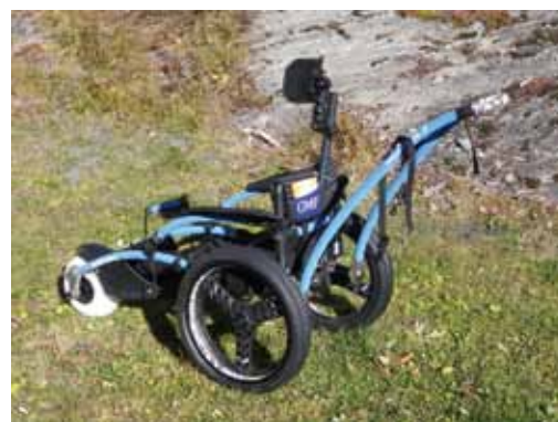
Fauteuil hippocampe

Pour les personnes à mobilité réduite, tous les refuges-portes et certains sites vont être progressivement équipés des fauteuils tout chemin, qu'on appelle aussi « fauteuils hippocampe* ». Dotés de deux roues à l'arrière, ils sont prolongés par une seule roue à l'avant. Ces véhicules sont indispensables pour suivre certaines animations. Il est maintenant possible pour une personne se déplaçant en fauteuil d'observer les marmottes ou d'effectuer des randonnées au cœur du Parc.