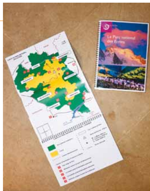
Brochure du Parc national des Écrins

L'Association Alpes Regards 05 a largement contribué à l'élaboration de ce document. A la grande satisfaction des non-voyants : « quand on arrive ici, on a l'impression d'être accueillis, qu'on a fait beaucoup d'efforts pour nous faire imaginer ce qu'est le parc des Écrins et c'est très important ».