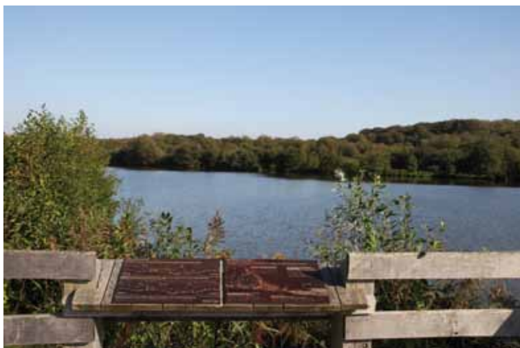
RN Marais de Condette - Crédit : Eden 62

Information et interprétation ne sont pas sœurs jumelles : les contenus, les objectifs et surtout les méthodologies employées ne sont pas les mêmes.