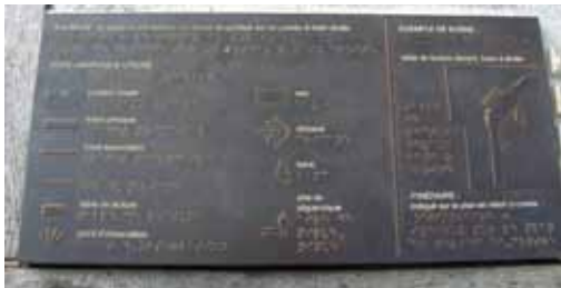
Mode d'emploi de la signalétique pour les personnes déficientes visuelles