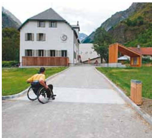
Maison du Parc national