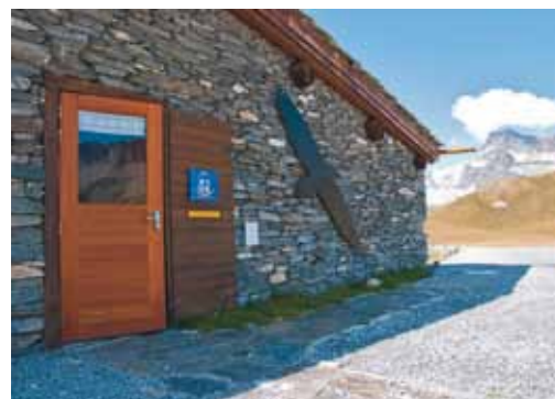
Exterieur du gîte

Pour voir le clip sur le refuge rendez-vous sur www.parcnationaux.fr , rubrique découvrir - visiter - partager.