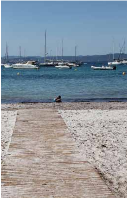
Le platelage amovible de la plage d'Argent