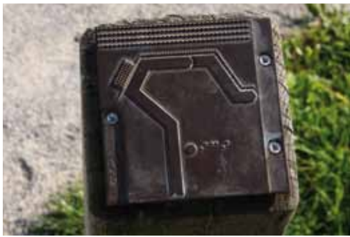
Plaque directionnelle en laiton

Quand le gestionnaire a aménagé le site pour pouvoir accueillir des personnes en situation de handicap, il a également conçu une signalétique directionnelle qui convient à tous les publics, y compris au handicap visuel ou mental.