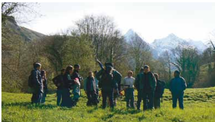
Formation Aten avec Louis Espinassous

Dans le cas de l'éducation à la nature, l'éducation sensorielle sert à jeter les bases d'une éducation plus informelle et d'une conscientisation vis-à-vis de la nature.