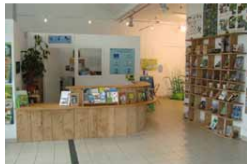
Accueil de l'espace nature

Nul doute que la prochaine exposition, spécialement conçue pour être accessible aux personnes en situation de handicap (son, toucher, visuel et expérience...), permettra de relancer la communication vers ce public et d'augmenter la fréquentation.