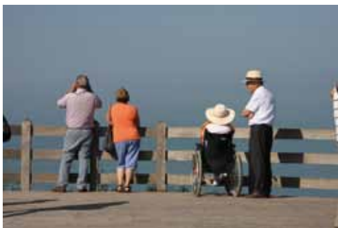
Cap Blanc Nez