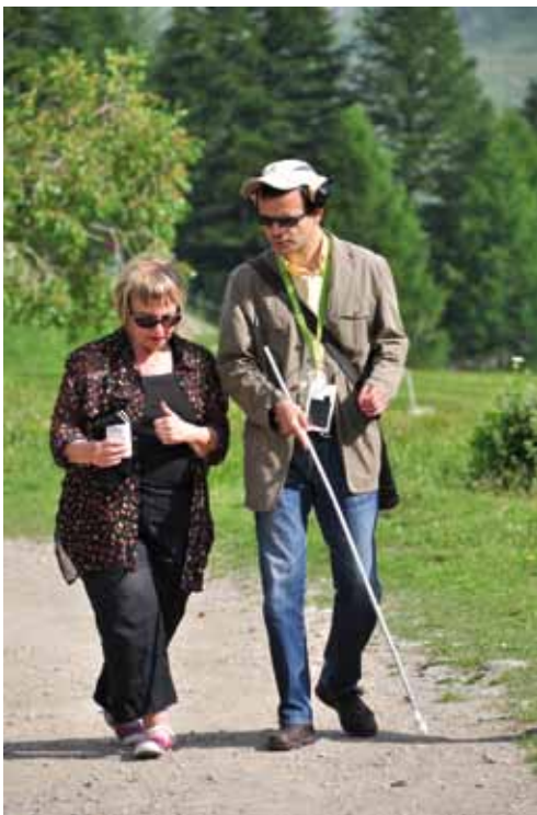
Déficient visuel sur le sentier du Lauzanier - PNM Crédit : Patrick Desgraupes

La loi n° 2005-102 du 11 février 2005 pour l'égalité des droits et des chances, la participation et la citoyenneté des personnes handicapées, a posé le principe d'égalité entre toutes les personnes et l'accès, dans la plus grande autonomie possible, entre autres aux vacances, au tourisme et aux pratiques éducatives, culturelles, sportives et de loisirs.