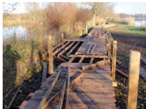
Travaux de rénovation du platelage par un chantier d'insertion - Crédit : Eden 62

La nouvelle population qui fréquente aujourd'hui le Romelaëre verrait d'un mauvais œil un retour en arrière mais prenons garde à ne pas aller vers une fuite en avant, et oublier ce qu'était le Romelaëre avant 1999. J'ai aujourd'hui l'impression de voir du Romelaëre un peu partout ; les platelages poussent comme des champignons dans de nombreux sites naturels, ce qui tend à une banalisation des cheminements en sites naturels. Les animateurs nature sont peut-être en mesure d'apporter une réponse dans la minimisation des aménagements. Ils sont capables d'emmener des personnes différentes sur des sentiers plus difficilement accessibles. Même si les personnes en situation de handicap physique sont certainement celles qui ont le plus besoin de sentiers adaptés, on peut leur imaginer une nouvelle approche. En réduisant les coûts des équipements, on pourrait transférer une partie de l'investissement vers des outils adaptés comme la Joëlette*, l'hippomobile*, la randoline*....que l'animateur nature pourrait utiliser. L'effort vaut le coût car l'accès à la nature par l'éducation doit se faire pour tous. Mais il ne faut pas oublier que l'accessibilité, ce n'est pas tout ou rien, et que bien connaître la population utilisant le site est la clé d'un aménagement raisonné.