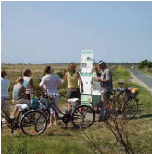
Charlotte près de la piste cyclable