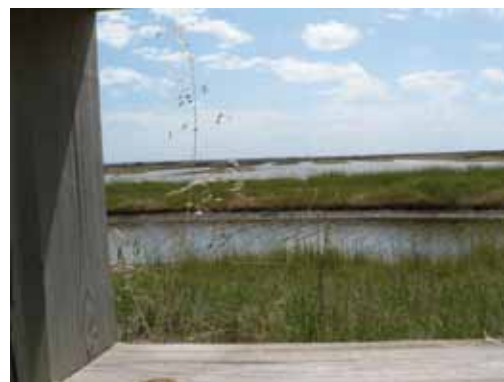
Vue sur la réserve de Moëze-Oléron

Aujourd'hui, cet aménagement porté par la communauté de communes Sud Charentes permet d'intégrer l'espace protégé dans un développement économique local basé sur l'éco-tourisme, et d'accueillir les 20 000 visiteurs annuels dans de bonnes conditions. L'accueil et l'animation confortent la mission de gestion de la réserve naturelle.