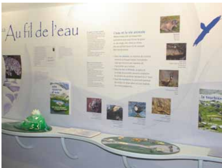
Maison du Plan d'Aste - PNP